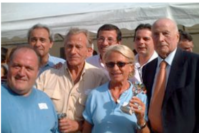
Les élus et personnalités du 16 e

Le dimanche 11 juin dernier, sur les pelouses des jardins du Ranelagh, s'est déroulé une très belle journée de sport et de convivialité autour d'un « challenge de pétanque », journée organisée au profit des Cheveux Blancs du 16 e arrondissement.