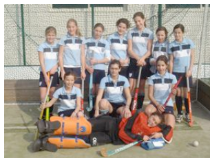
L'équipe minime de hockey 2005-2006