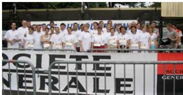
Les participants au 1 er cross de la CRF du 16 e