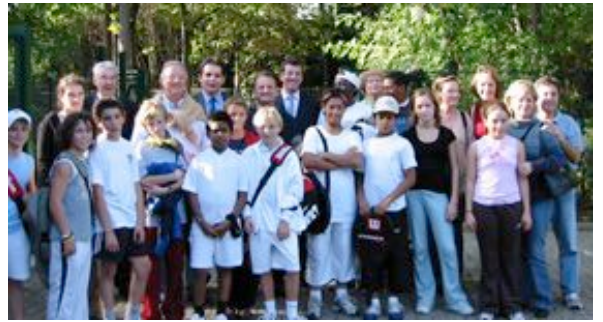
Les participants et organisateurs de l'édition 2005

Les vainqueurs seront récompensés par une coupe et tous les participants recevront une médaille de participation de l'OMS et des lots grâce à la générosité de nos partenaires.