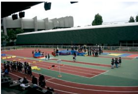
Stade Français Géo André

Stade Géo André (Stade Français 01 40 71 33 48 / 49) 2 rue du commandant Guilbaud 75016 PARIS Porte de Saint-Cloud Enfants de 6 à 10 ans